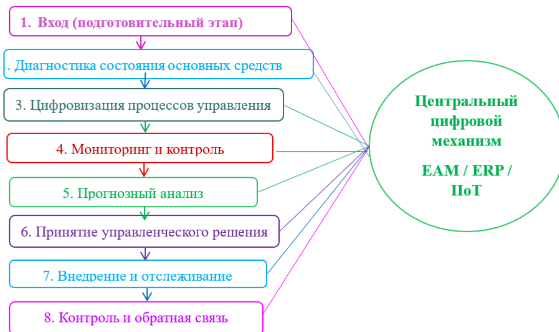
Рисунок 1. Алгоритмическая схема внедрения интегрированного (на основе холистического подхода) механизма управления основными средствами (на примере текстильных предприятий) 1

Алгоритм формирования интегрированного механизма управления основными средствами включает несколько последовательных этапов, каждый из которых представляет собой звено в общей системе управления активами. Эти этапы охватывают весь цикл — от диагностики состояния фондов до внедрения цифрового мониторинга и оценки результативности (Рисунок 1).