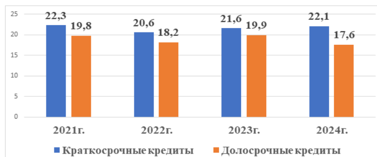
Рисунок 2. Среднегодовая процентная ставка кредитов Национального банка, предоставленных субъектам малого бизнеса, в национальной валюте 3 , %

Как видно из рис. 1, в Национальном банке доля проблемных кредитов, предоставленных субъектам малого бизнеса в общем объеме кредитов, предоставленных субъектам малого бизнеса в 2022 году существенно возрос по сравнению с 2021 годом. Однако, значение данного показателя в 2023 году значительно уменьшилось по сравнению с 2022 годом. Вместе с тем, доля проблемных кредитов, предоставленных субъектам малого бизнеса в общем объеме кредитов, предоставленных субъектам малого бизнеса в 2024 году существенно снизилась по сравнению с 2021 годом (Рисунок 2).